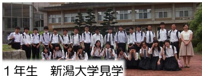
1年生 新潟大学見学

8月9日に1年生が新潟大学の見学に行ってきました。また一つ、意識を高めるきっかけになったようです。また、8月21日、22日に3年生の進学合宿がありました。志賀高原の涼しい空気の中、仲間同士、お互いを高め合う充実した時間となりました。