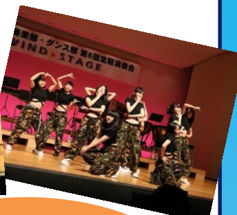
ジャズコンサートの様子