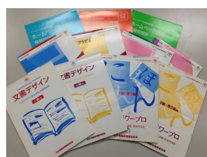
各種検定のテキスト